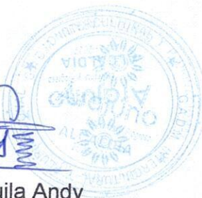
Lcdo. Darwin Francisco Tanguila Andy ALCALDE DEL GAD MUNICIPAL INTERCULTURAL Y PLURINACIONAL DEL CANTÓN ARAJUNO